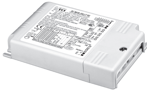
DC MAXI JOLLY HV